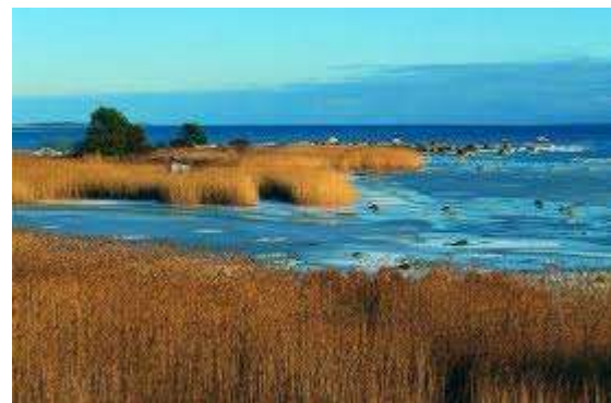
Laahemaa: Nationaal park